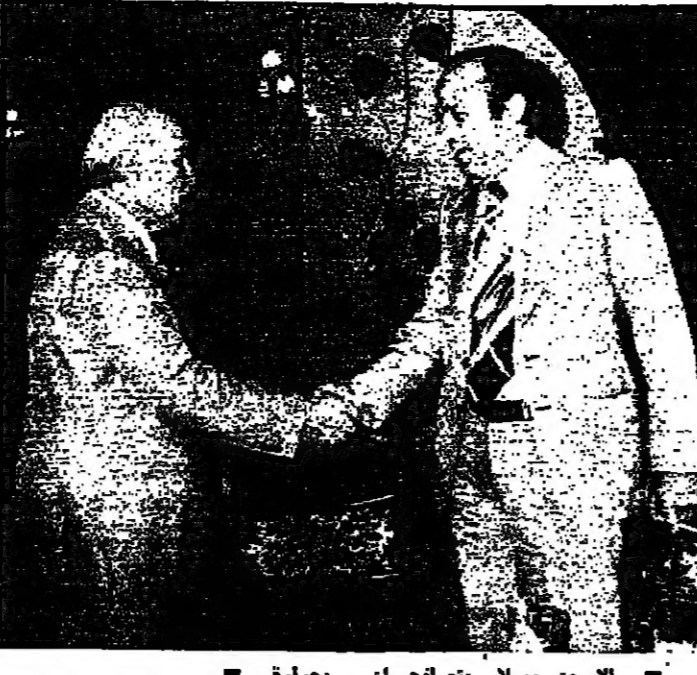
الاسعد والسلام بصفتهم .. بحرارة

في الساعة الرابعة والنصف انتهى حفل الغذاء وقال على اثره الرئيس صائب سلام : كان لقاء وديا على الصعيد الخاص ، وبقي صميم المصلحة الوطنية على الصعيد العام ، وكما كانت الاحاديث والاراد التي تتجلىها مديدة جدا ، وبالطبع ليس هو بلقاء الاخر ، ولكننا مستناب للقياسات المتعاون الاخلاص من اجل تليل ما اميننا من مقدمات في سبيل الوصول الى ما نبشده ابناء لبنان ، من أمن واستقرار وعودة الى الحياة الطبيعية ، والنهوض بلبنان من كبوته ، وهذا يتوقف اول ما يتوقف ، بل ان المسؤولية الاولى تقع على كواهل اللبنانيين انفسهم جريا على مبدأ « ما لك جسدك مثل فترتك » .